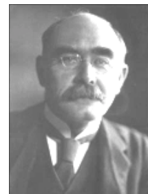
Rudyard Kipling 1865 - 1936

«The Ritual of the Calling of an Engineer has been instituted with the simple end of directing the young engineer towards a consciousness of his profession and its significance, and indicating to the older engineer his responsibility in receiving, welcoming and supporting the young engineers in their beginnings. »